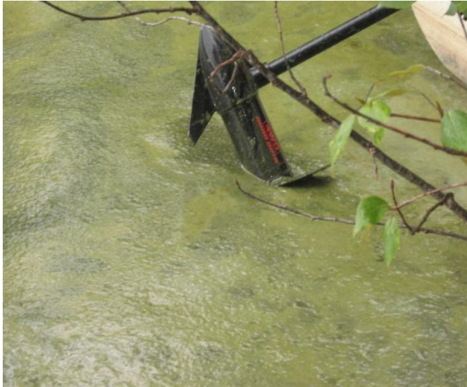
...SUR LE BORD DU LAC DURANT L'ÉTÉ (SITUATION SPORADIQUE)